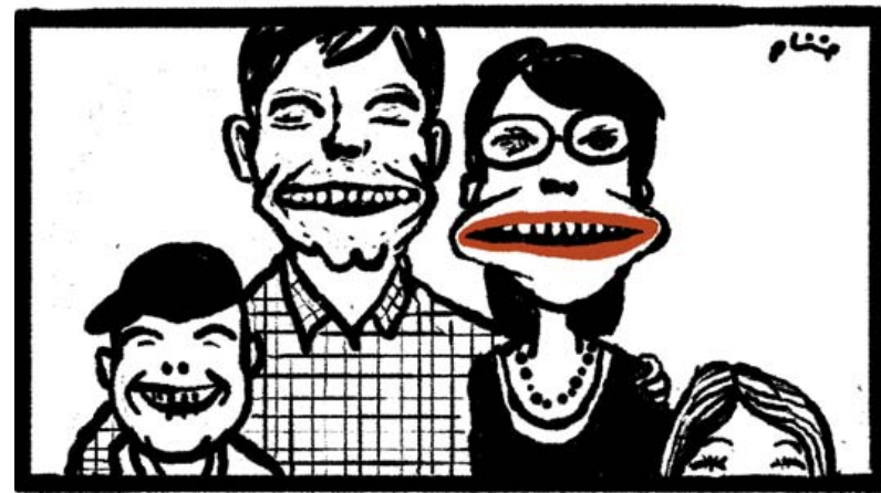
Tegning: Philip Ytounrel

Kernefamilien i dag bygger på en romantisk forestilling om den eneste ene, som med børnenes ankomst manifesterer sig i et konkret arbejdsfællesskab. Det