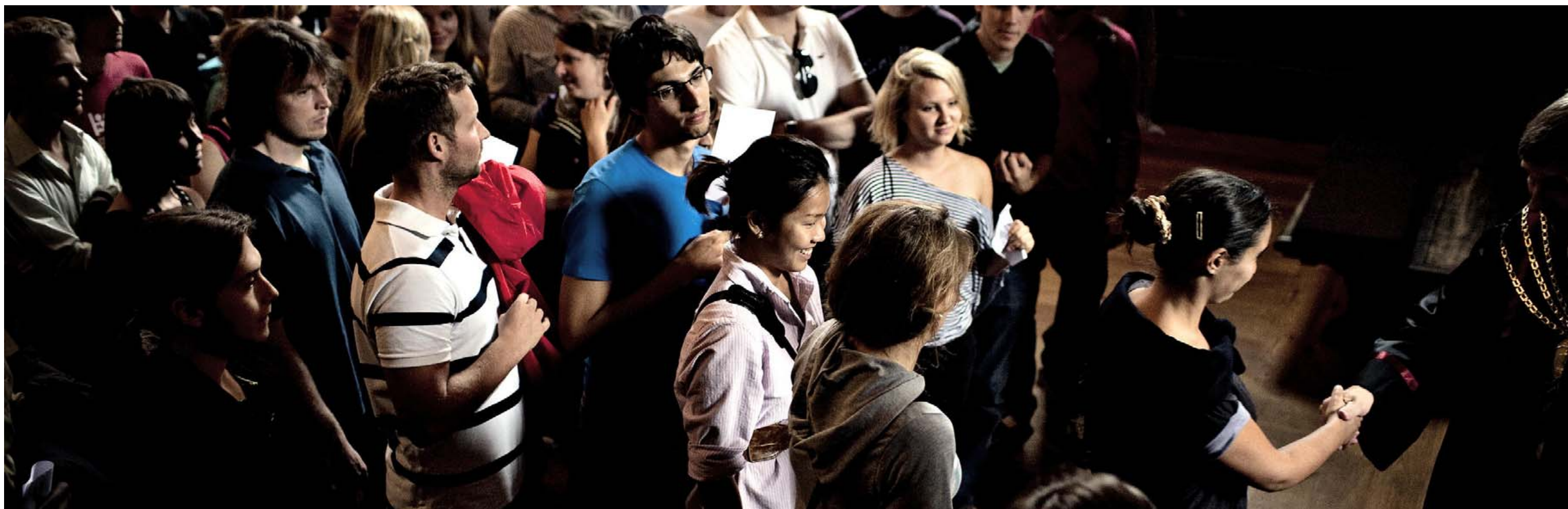
STUDERENDE. Jo tidligere man kommer i gang med at understøtte og udvikle det enkelte barns mange færdigheder, des større er chancen for, at flere børn vil kunne takle de udfordringer, en lang videregående uddannelse byder på.